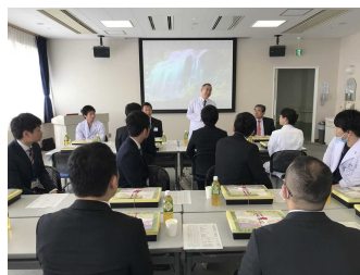
平成31年3月7日の 病院見学バスツアーの様子